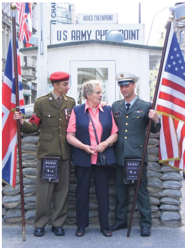
Abbildung 4: „Grenzbeamte“, Touristin

Die Initiativen des Senats („exhibition as knowledge“), des Museum Haus am Checkpoint Charlie („exhibition as museum dis-