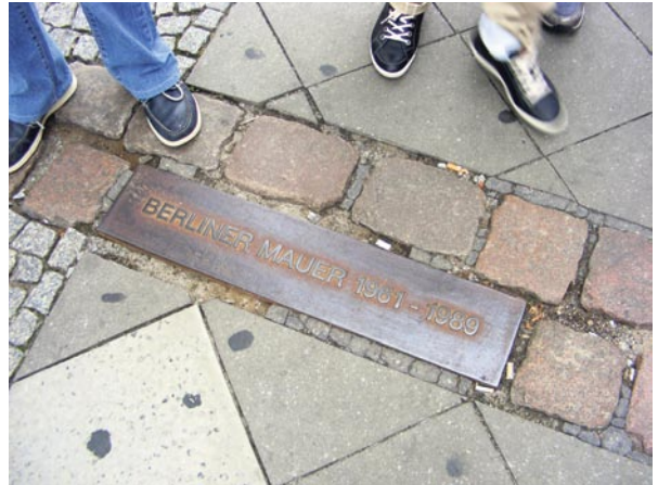
Abbildung 2: Ehemaliger Mauerverlauf

Bereits im 18. Jahrhundert war in Plymouth die Stelle, an der 1620 die erste Pilgerin ihren Fuß auf amerikanischen Boden gesetzt hatte, mit einer Gravur versehen worden ( Abbildung 1 ). Der so markierte Plymouth Rock wurde 1920 mit einem kunstvoll gestalteten Portikus überbaut, der den Fels weithin sichtbar machen sollte. Um auch die Lebenswelt der Pilgerinnen und Pilger anschaulich werden zu lassen, wurde in den 1940er Jahren ganz in der Nähe die Plimoth Plantation eröffnet. Sie bestand aus einem Museum, das Fundstücke der Ausgrabungsstätte des alten Pilgerdorfs präsentierte, und Plimoth Village, einer Rekonstruktion des Dorfes, das mit epochengerecht kostümierten Schauspielerinnen und Schauspielern belebt war. Diese sollten den Besucherinnen und Besuchern