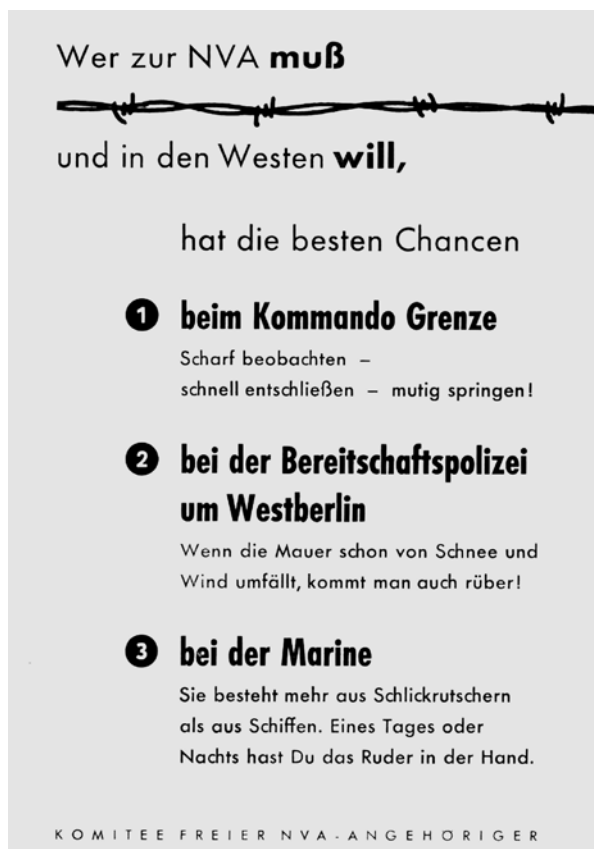
Abbildung 1: PSK-Flugblatt (1960er Jahre)