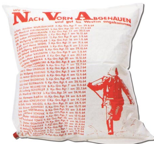
Abbildung 2: Propagandakissen

18 Insofern arbeiteten diese Bilder schon nach dem Prinzip der „Visuellen Kommunikation“, wie sie von Werner Kroeber-Riehl in den 1970er Jahren für die Werbewirtschaft entwickelt und etwa in der Kampagne der visuell „geöffneten Horizonte“ („Wir machen den Weg frei!“) für die Volksbanken/Raiffeisenbanken umgesetzt wurde.