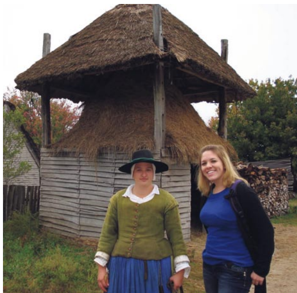
Abbildung 3: „Pilgerfrau“, Touristin