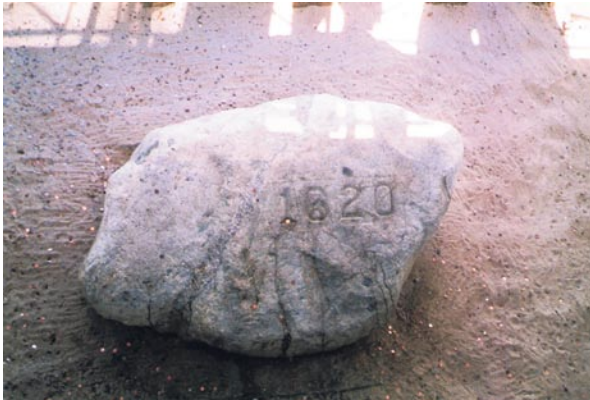
Abbildung 1: Plymouth Rock